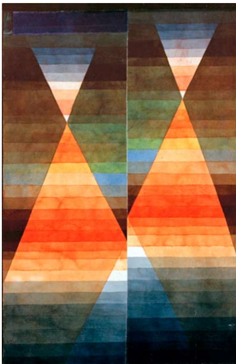
«Doppelzelt» von Paul Klee (1923)

Abdruck mit freundlicher Genehmigung vom 24.06.2011 seitens der Stiftung Rosengart